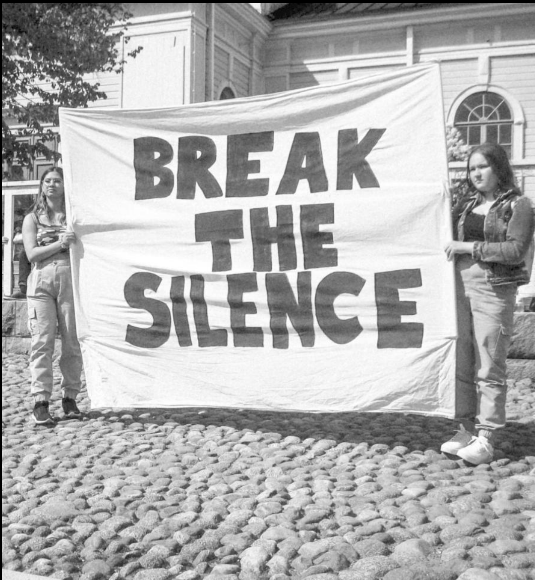
Kuva: Black Lives Matter, Helsinki 2020, Luiza Preda (HK8239:23), rajattu