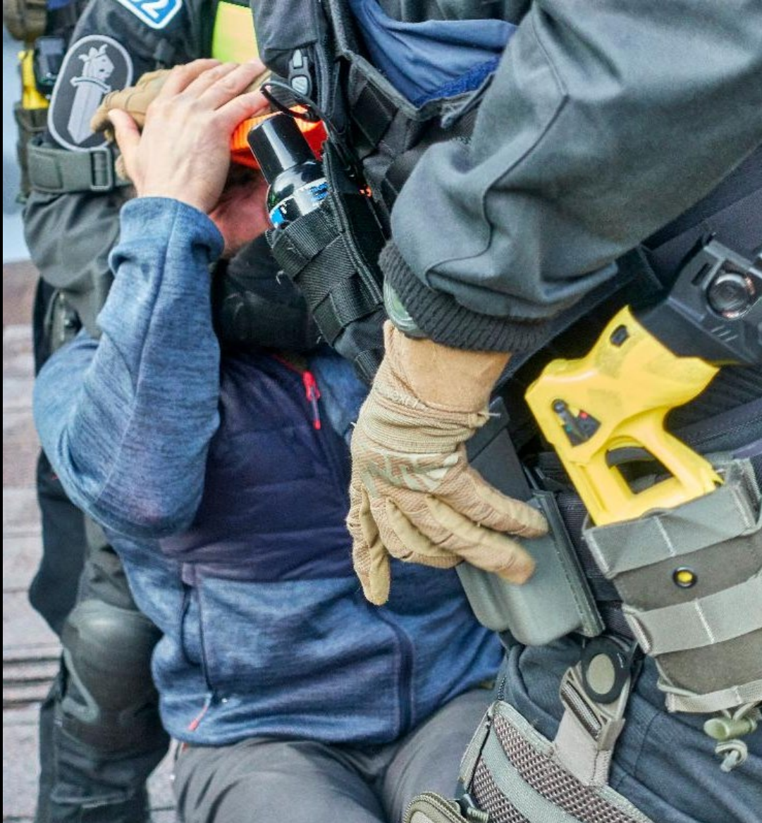
Kuva: Turkki ulos Rojavasta / poliisiin vallankäyttö, Helsinki 2019, Hannu Häkkinen (HK8189:28), rajattu