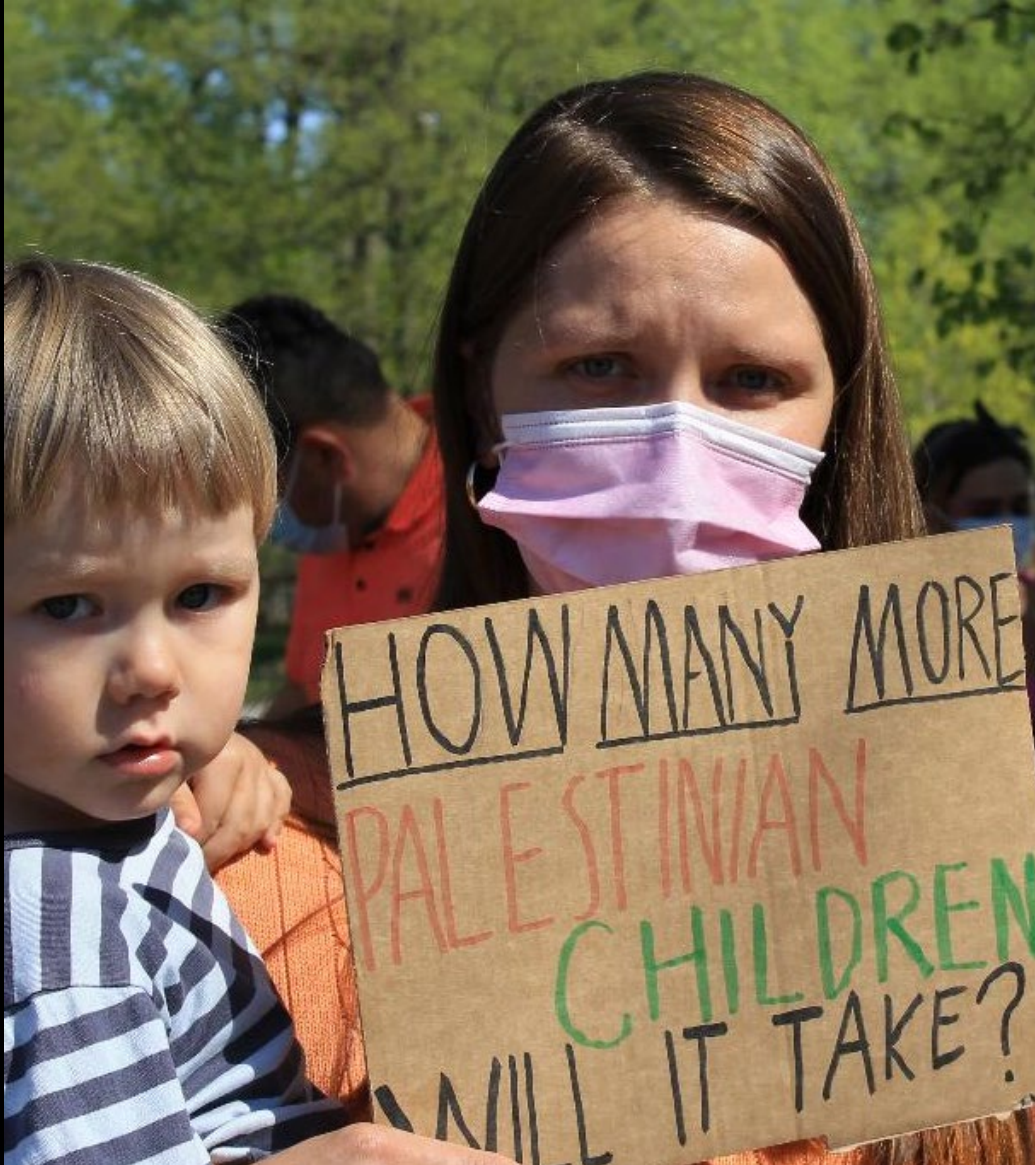
Kuva: Mielenilmaus Palestiinan puolesta, Turku 2021, Rilla Ritakallio (HK8231:34), rajattu