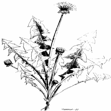
Voikukka (piirros T. Kahila -01)

3.1 Mitä tarkoitetaan kulttuuri- ja perinneympäristöllä?